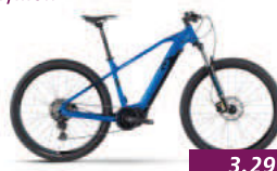
HardRay E 6.0 Raymon