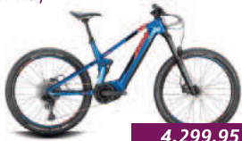
Xyron S 2.7 Conway