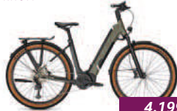
Entice 5.B Kalkhoff